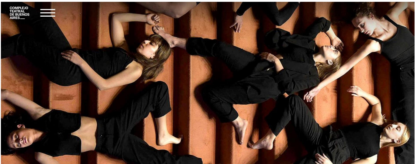
Danza-Teatro San Martín

Danza en el HALL- Teatro San Martín- 14, 15 y 16 de junio