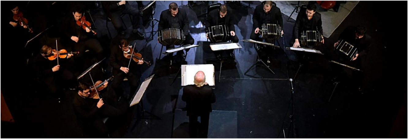
Orquesta de Tango-Funciones-Entradas

TANGO- Dos funciones al mediodía (Teatro San Martín), una a la noche (Cine Teatro El Plata)