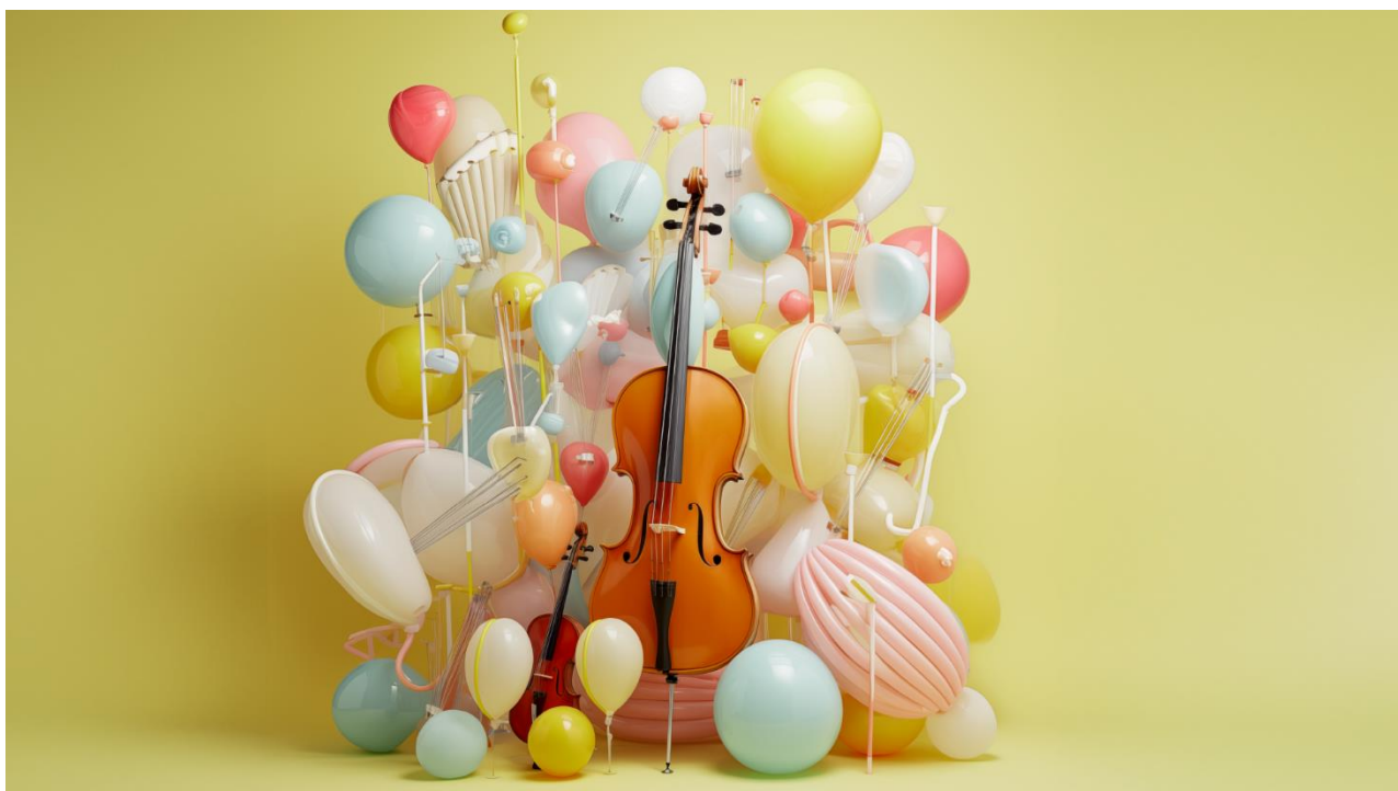
Vacaciones de invierno-Niños