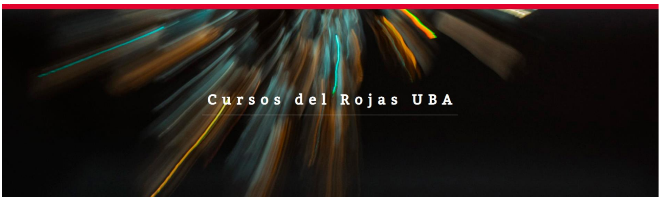
Centro Cultural Rojas