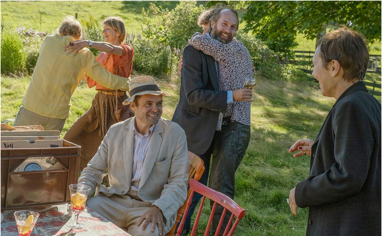
Cine en junio-CCK