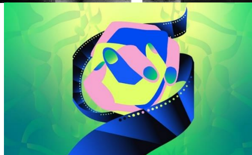
Festival de Cine ambiental Alianza Francesa Finca-Sedes-Programación completa