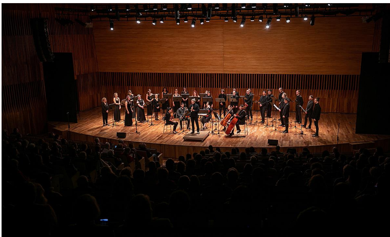
Conciertos al mediodía-Junio-Inscripción